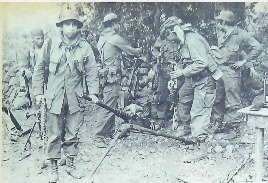
MUESTRAN ARMAS INCAUTADAS EN SUCHITOTO. Un valioso arsenal y material de guerra, fue encontrado por tropas del ejército que dismantelaron un campamento subversivo en el Cantón Palo Grande Suchitoto. Por lo menos en el área otros diez campamentos más fueron destruidos por la Fuerza Armada y en ellos se encontró armas, medicinas, aparatos de transmisión, un taller de bombas, y una escuela de entrenamiento. En la gráfica el coronel Domingo Monterrosa, Comandante del Batallón "Atlacatl", muestra una ametralladora Punto 50, que pertenecía a la subversión. Soldados que le acompañan observan otras armas encontradas.

"Los extremistas mantuvieron sitiada la ciudad durante 12 días, habiéndose retirado el lunes hacia Aguilares, siendo perseguidos por unos 2 000 soldados; al mismo tiempo, batallones especializados se mantienen combatiendo en el citado cerro".