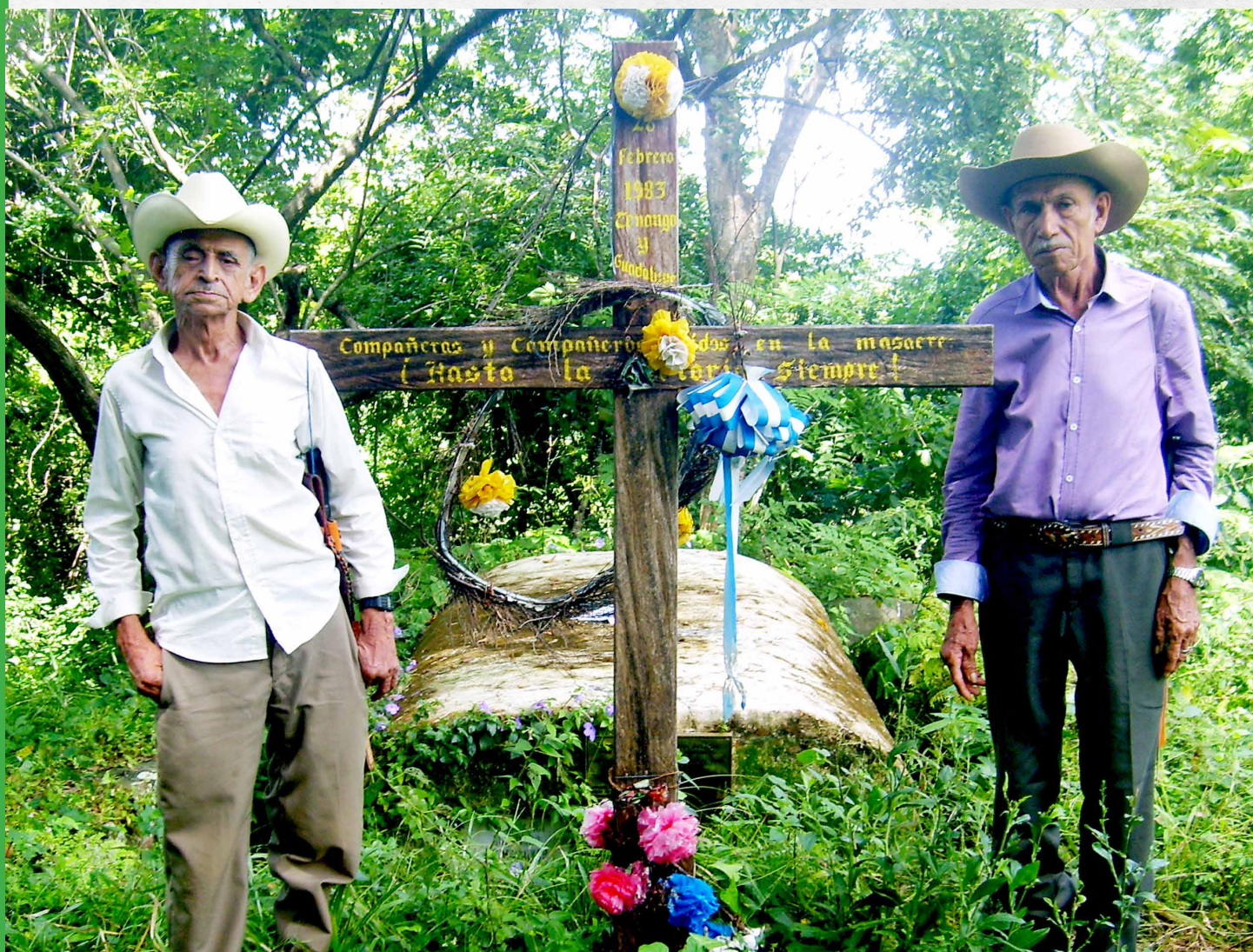
Monumento a víctimas de masacre de Guadalupe y Tenango, 28 de febrero 1983

La Prensa Gráfica · 10 de noviembre de 1985 pág. 3 y 30